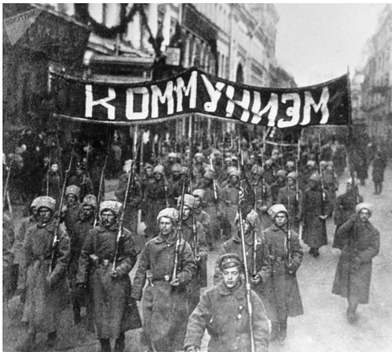
Колонна революционно настроенных солдат с лозунгом «Коммунизм» идет по Никольской улице в Москве. 1917 год

Однако такая оценка капитализма не просто противоречит заявленным самим же Советом его проблемам, как нарушение климата, кризисы в области общественного здравоохранения и социальные волнения. Совет цинично игнорирует принцип историзма, а именно трансформацию прогрессивной роли капитализма по сравнению с феодализмом в XIX веке в связи с первой промышленной революцией, связанной с применением машин, в реакционную в XX и XXI веках, связанную с большими разрушениями производительных сил в ходе мировых и локальных войн, с ростом нищеты и безработицы, ухудшением экологии. Стремясь сохранить и приумножить свою власть, Совет объединяет все активные аморальные и порочные силы для противодействия второй промышленной революции, призванной утвердить социализм для решения проблем капитализма и обеспечения всестороннего развития личности.