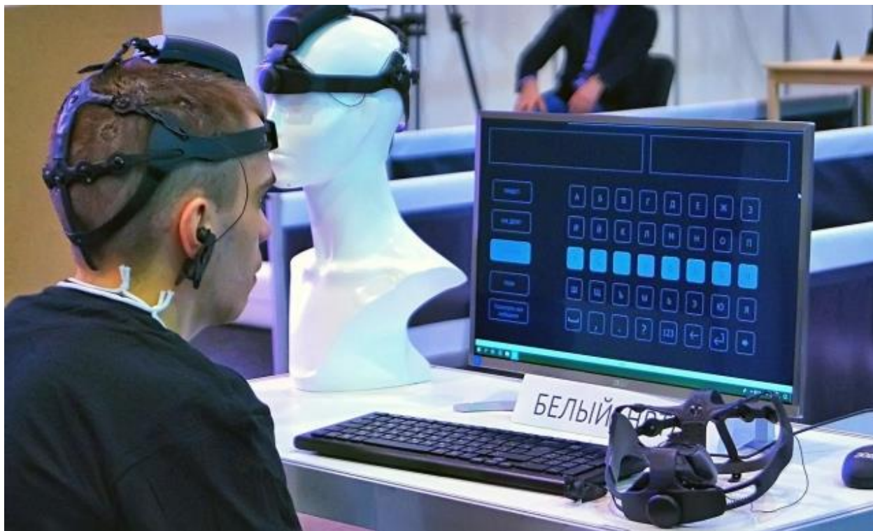
Перед экраном Mos.ru

Практическая реализация обоих проектов предполагает использование возможностей современных информационных технологий, а точнее, искусственного интеллекта (ИИ). Первый проект нуждается в создании ИИ для эффективного управления экономикой, второй — в создании ИИ для тоталитарного управления людьми.