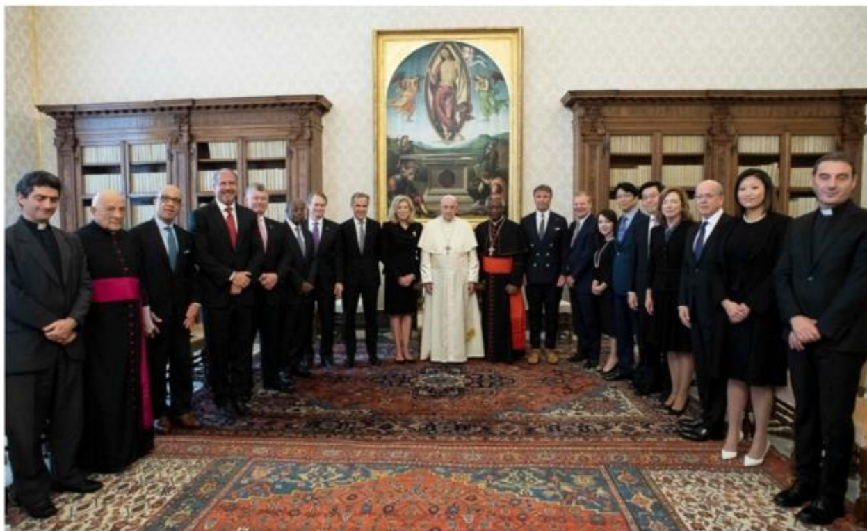
Папа Римский Франциск с членами Совета по инклюзивному капитализму